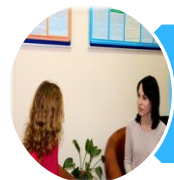
Кабинет психолого-социальной помощи